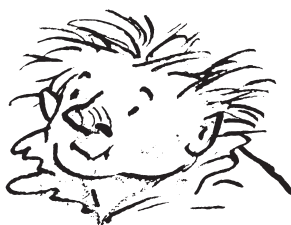
Trínculo e Estéfano Marinheiros