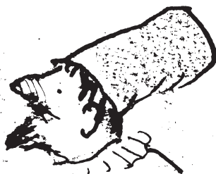
Alonso Rei de Nápoles