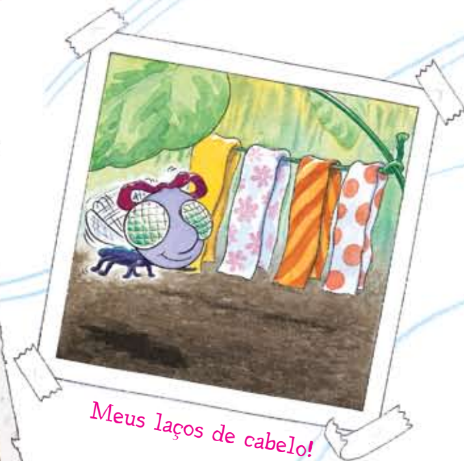
Meus laços de cabelo!