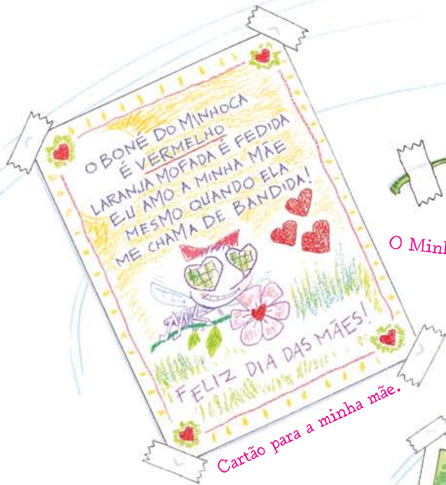
Cartão para a minha mãe.