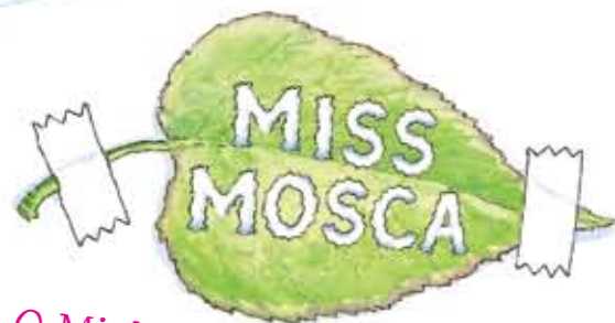
O Minhoca mastigou isso pra mim.