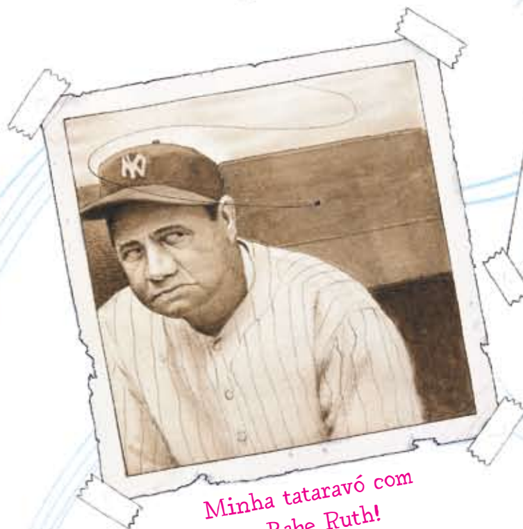
Minha tataravó com o Babe Ruth!