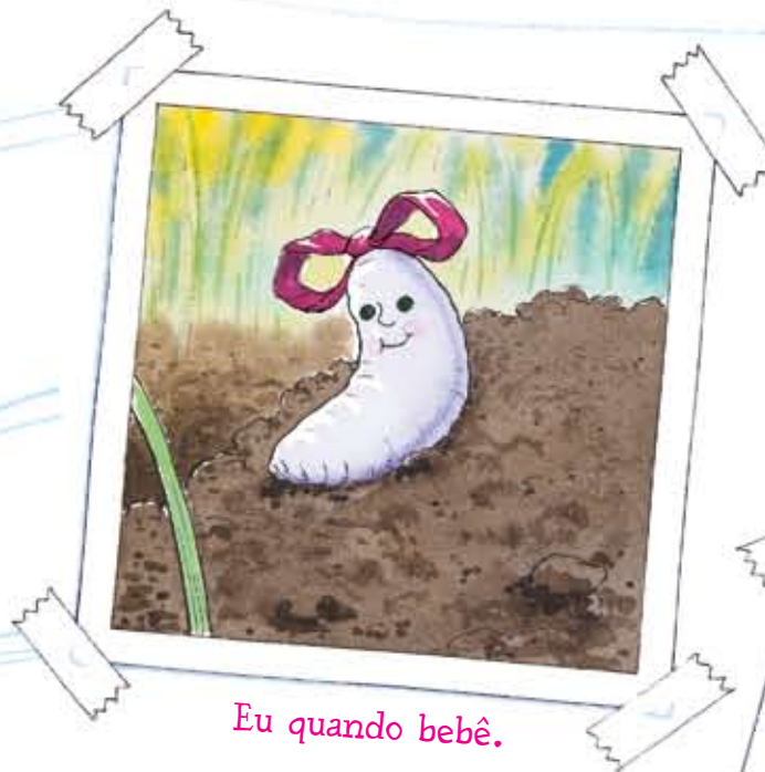
Eu quando bebê.