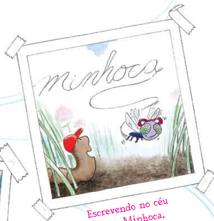
Escrevendo no céu com o Minhoca.