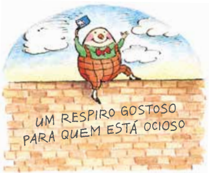
Um furo ‘DEFINIÇÕES DUMPTY’